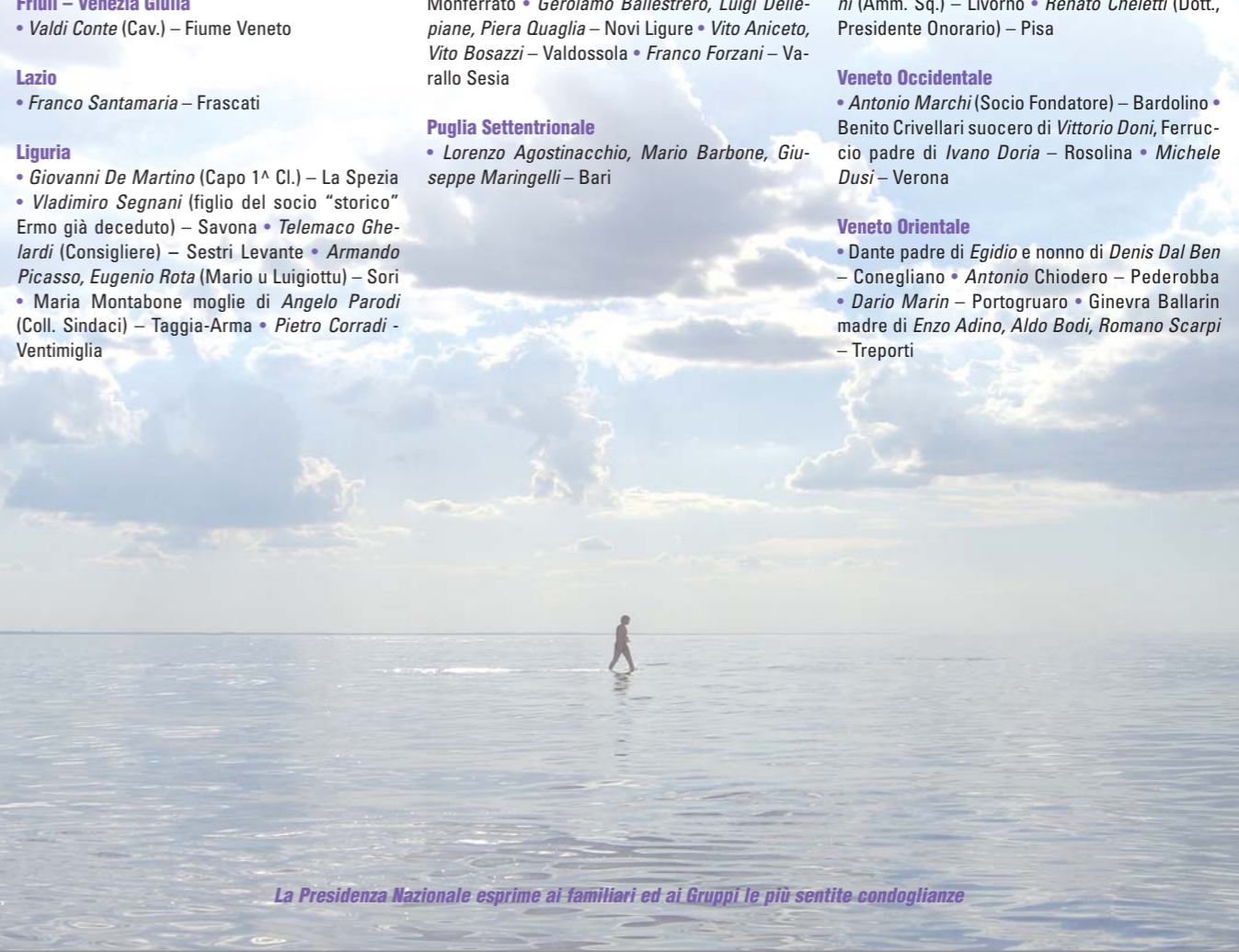
La Presidenza Nazionale esprime ai familiari ed ai Gruppi le più sentite condoglianze