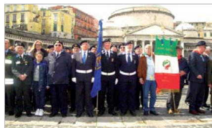
La rappresentanza del Gruppo "MOVVM Pietro de Cristofaro" intervenuta alla cerimonia organizzata dalla Prefettura in Piazza Plebiscito