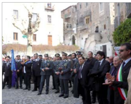
Partecipazione del Gruppo "V. Jelpa" alla manifestazione promossa dal Comune: corteo fino alla Biblioteca Comunale, dibattito pubblico sul contributo della Calabria, e di Scalea in particolare, all'unificazione dell'Italia, con intervento dei Proff. Enrico Esposito (di Scalea) e Ciro Cosenza (di Diamante)