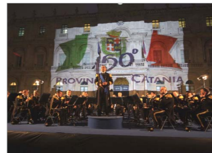
La Banda della MM sullo sfondo dell'antica sede dell'Università di Catania