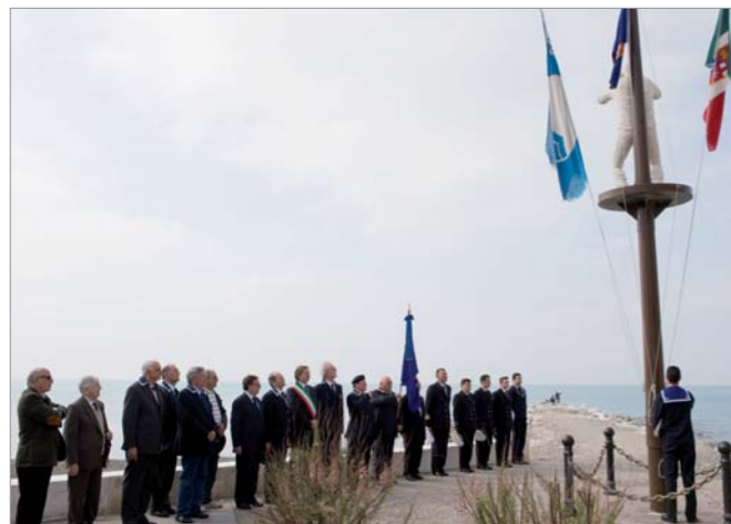
Un momento della Cerimonia dell'alzabandiera