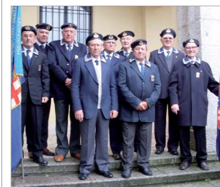
La rappresentanza del Gruppo "Livio Scotto" che ha partecipato alla cerimonia organizzata dall'Amministrazione Comunale di Monte Argentario