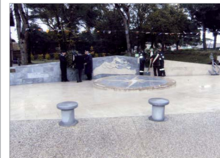
Particolare delle cerimonia al monumento ai Caduti del Mare