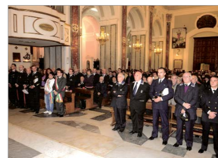
Partecipazione del Gruppo "A. Torre" alla manifestazione, svolta nella Basilica Santa Trofima a cura dell'Amministrazione Comunale, durante la quale sono stati consegnati diplomi e medaglie ai Reduci della 2ª guerra mondiale