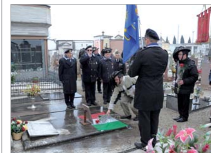
Domenica 27 febbraio: partecipazione di una delegazione del Gruppo "STV Tito Malaguti" alla cerimonia commemorativa dei Soci della Sezione dell'A.N. Bersaglieri scomparsi, svolta nel cimitero di Castellucchio (MN)

Domenica 10 aprile, Soci del Gruppo (unitamente a Soci del Gruppo di Peschiera del Garda) sono intervenuti alla cerimonia celebrativa della "nascita" della Bandiera della Regia Marina avvenuta nell'aprile