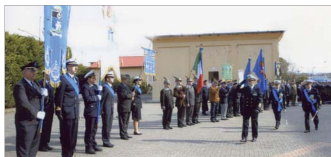
Il C.S.M. della Marina passa in rassegna i Reparti