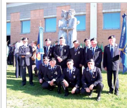
Le rappresentanze dei Gruppi "MOVVM Alberto Banfi" (Cuorné) e "CGVM Mario Cagnassone" (Venaria Reale) intervenute alla cerimonia per il 60° anniversario della fondazione del Gruppo dell'A.N. Alpini di San Carlo Canavese e la benedizione del riposizionato monumento ai Caduti di tutte le guerre