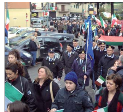
Partecipazione del Gruppo "CGVM Ciniio Funari" alla manifestazione cittadina; particolare del corteo