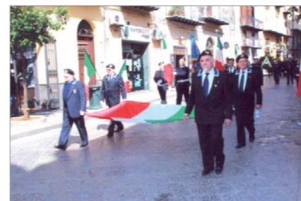
Particolare del corteo