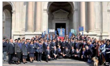
Foto ricordo sul sagrato della Basilica con l'Arcivescovo e Prelato di Pompei

Vergine del Rosario officiata da Don Antonio Protno; saluto dell'Arcivescovo S.E. Mons. Carlo Liberrati; alza Bandiera e deposizione di una corona al monumento ai Caduti di tutte le guerre.