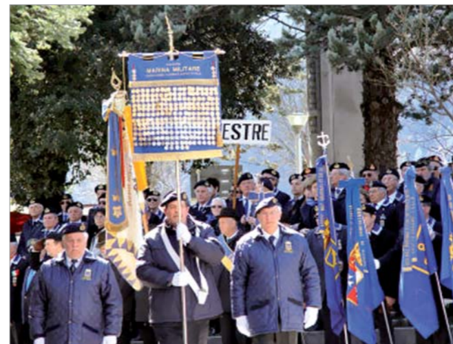
Il Medagliere della Marina