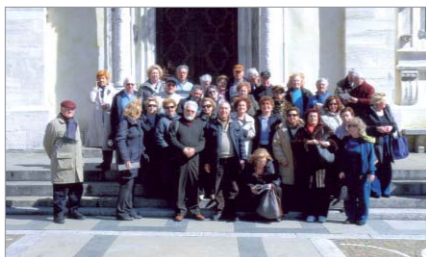
Foto ricordo sul sagrato della Cattedrale di Tirano

Valtellina con visita alle cittadine di Tirano, Chiuro, Boario Terme e a due Cantine Sociali sulle colline della Franciacorta.