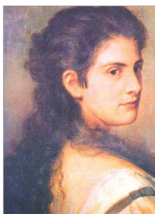
Antonietta De Pace, fulgido esempio di eroina del Risorgimento Meridionale