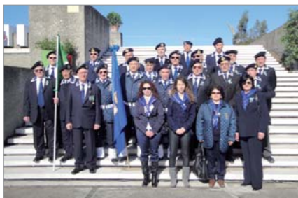
Soci/e intervenuti ripresi sulla scalinata del monumento ai F.lli Bandiera

Vallone; Arcivescovo S.E. Mons. Domenico Grazianni; autorità civili e militari; studenti e Associazioni d'Arma.