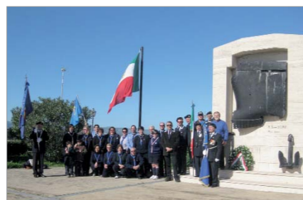
Cerimonia dell'alza Bandiera e deposizione di una corona al monumento ai Caduti del Mare organizzata dal Gruppo "MOVM Ignazio Castrogiovanni", congiuntamente ai Gruppi Scout AGESCI e MASCI