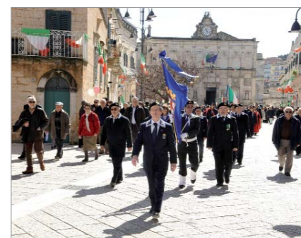
Particolare del defilamento per le vie cittadine