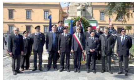
Al termine della cerimonia al monumento a Caduti