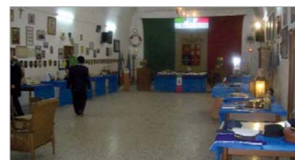
Parziale veduta della mostra allestita nella Sede del Gruppo