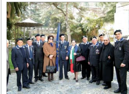
Partecipazione del Gruppo "Vittorio Guagliani" alla cerimonia al monumento ai Caduti, presente Mons. Bilotto, Vicario dell'Arcivescovo di Cosenza