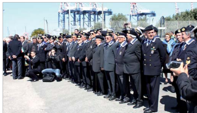
Lo schieramento dei Gruppi ANMI sul luogo della cerimonia