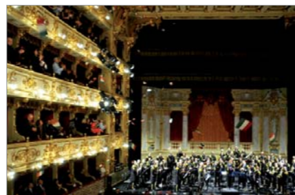
La Banda della Marina suona l'Inno di Mameli

Una numerosa rappresentanza di Soci e familiari del Gruppo "MAVM Cesarino Gatta" ha partecipato al concerto tenuto al Teatro Regio dalla Banda Musicale della Marina con musiche risorgimentali e sinfoniche. Particolare commovente la pioggia dai palchi di bandierine tricolori all'intonazione dell'Inno Nazionale.