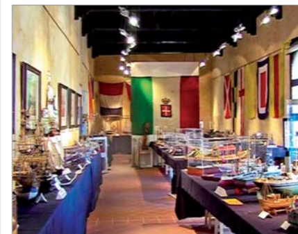
Parziale veduta della Mostra