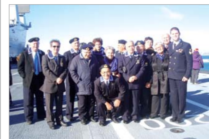
Soci e familiari del Gruppo "Giuseppe Santo" durante la visita a bordo della Portaerei Cavour in porto a Taranto