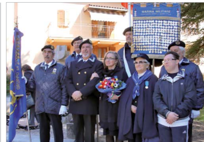
Foto ricordo con il Presidente Nazionale Amm. Sq. Paolo Pagnottella