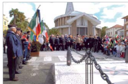
Parziale panoramica durante la cerimonia al monumento ai Caduti del Mare a Numana