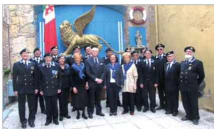
Foto ricordo della visita

Cerimonia dell'alza Bandiera nel cortile della Sede