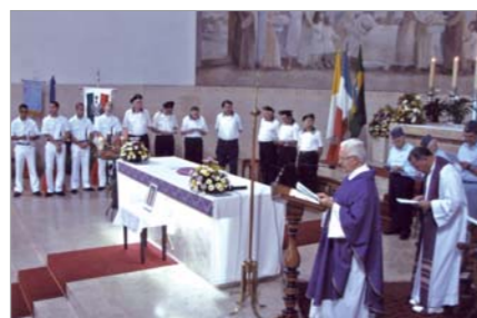
S. Messa nella Chiesa degli Italiani officiata dal Cappellano del Gruppo Don Giorgio e dal C.C. Frei Odeco