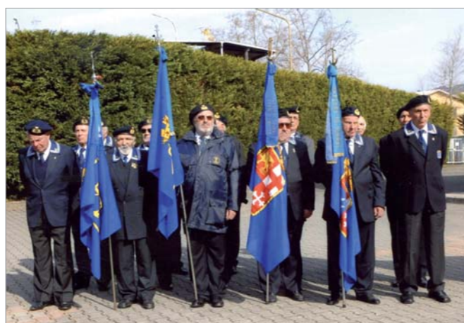
Lo schieramento della rappresentanza ANMI