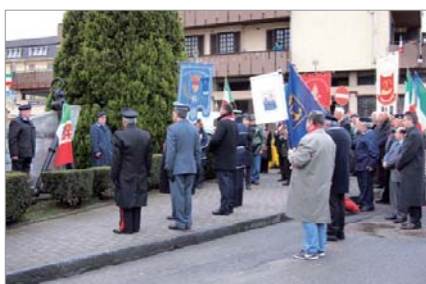
Il Gruppo "MOVVM Alberto Banfi" ha partecipato alla manifestazione Buon Compleanno Italia organizzata dall'Amministrazione Comunale. Nella foto, particolare della deposizione di una corona d'alloro al monumento ai Caduti del Mare