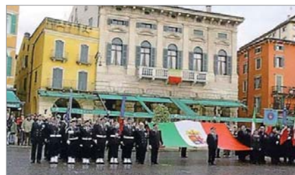
Presenza del Gruppo "MOVVM Tolosetto Farinati degli Uberti" alla cerimonia dell'alza Bandiera che ha aperto le celebrazioni ufficiali della ricorrenza