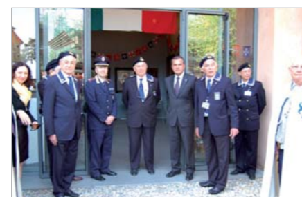
Due momenti durante l'inaugurazione della Mostra