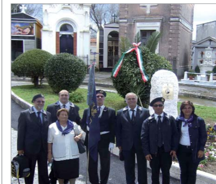
Partecipazione del Gruppo "Amm. A. Corbino" alla cerimonia organizzata dal Comune, in particolare (nella foto), onori alla tomba di Domenico Goglia, ufficiale garibaldino puteolano