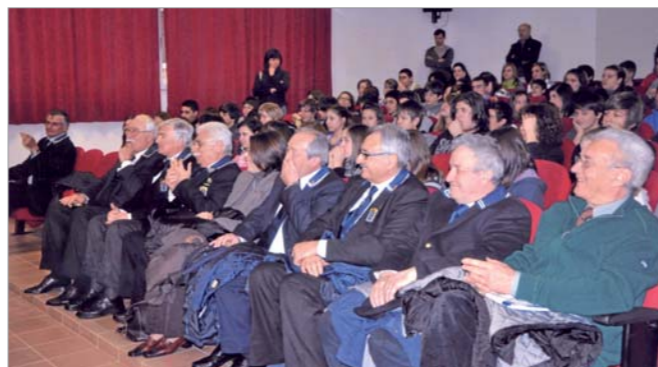
Parziale veduta dell'auditorium durante la conferenza del Presidente Nazionale