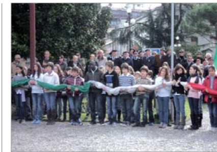
Marinai e studenti inneggiano all'Unità d'Italia