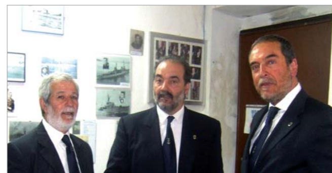
Due momenti durante la riunione