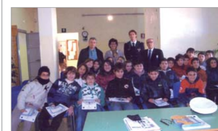
Due particolari vedute degli studenti