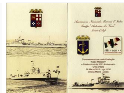
Fronte del pieghevole emesso dal Gruppo per la ricorrenza