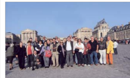
Soci e familiari durante la gita sociale di sei giorni a Parigi con visite a Versailles e Disneyland