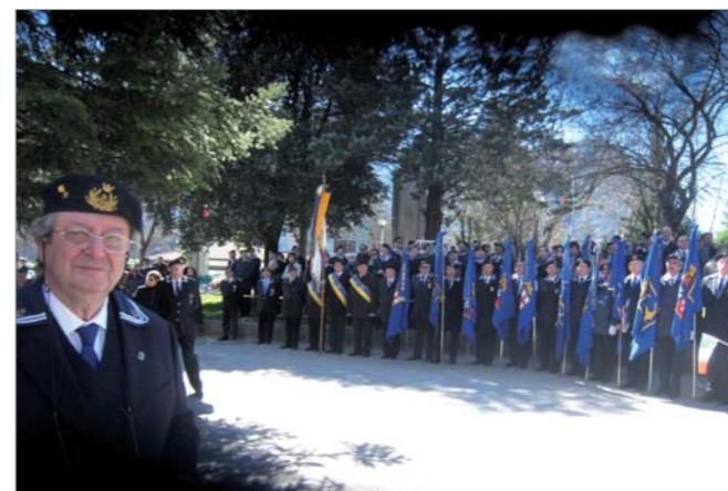
Lo schieramento dei Vessilli dei Gruppi ANMI di fronte al Monumento ai Marinai