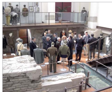
Parziale veduta della mostra