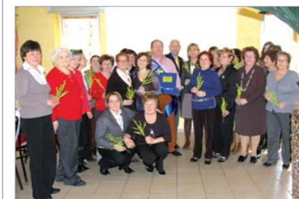
Il Gruppo ha festeggiato la Giornata della Donna. Pranzo al ristorante del Club House del Palalancia

La rappresentanza del Gruppo "MOVVM Com.te Ener Bettica" intervenuta alla celebrazione del 75° anniversario della costituzione del Gruppo Alpini di Mazzè. Altra rappresentanza ha partecipato alla manifestazione per il 50° anniversario della fondazione del Gruppo dell'A.N. Fanti di Torrazza Piemonte