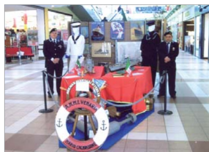
L'ingresso della Mostra a Ciriè