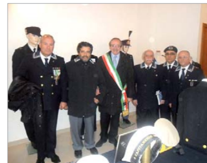
Foto ricordo con il Sindaco, Dott. Antonio Fitto, al termine dell'inaugurazione della mostra

Tricolore e Divise storiche della Marina (fornite dal Gruppo) e le scolaresche hanno tenuto spettacoli di danza, canti e giochi a tema