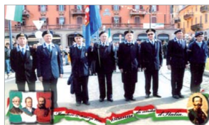
La rappresentanza del Gruppo "Tino Prato" che ha partecipato alla sfilata promossa dall'Amministrazione Comunale