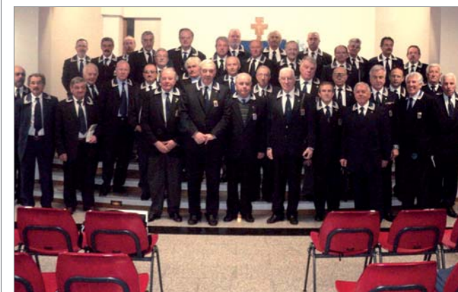
Foto ricordo al termine dei lavori

Questo è il mio mare, il mio mondo che sol di sogni vive: è il più bel mare del mondo.