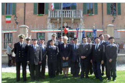
La rappresentanza di Soci intervenuti alla cerimonia a Volta Mantovana