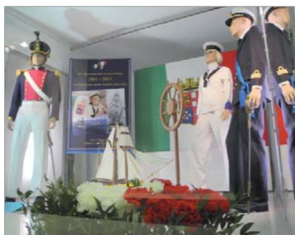
Una delle vetrine nel centro storico allestite dal Gruppo "MBVM Gian Oberto Genta", in collaborazione con Circomare Porto Garibaldi e con l'intervento del Gruppo Modellisti della L.N.I. e Soci ferraresi del Gruppo Castello di Brussa - Leone di San Marco