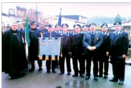
Intervento alla celebrazione della ricorrenza di Soci del Gruppo "2° C° Severino Meloni", unitamente a Soci dell'A.N. Arma Aeronautica e dell'Istituto Nazionale per la Guardia d'Onore alle Reali Tombe del Pantheon