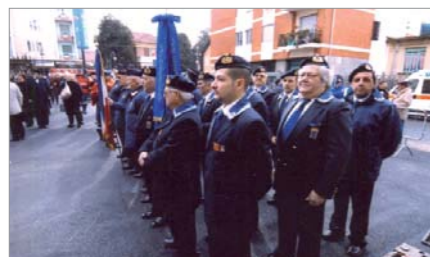
Lo schieramento dei Soci in P.zza Martiri della Libertà