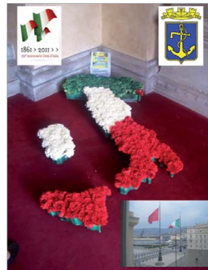
Immagine con la quale il Gruppo "MOVM Antonio Zotti" ha inteso rappresentare l'Unità d'Italia nel suo 150° anniversario