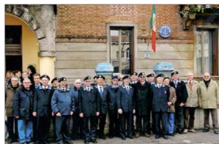
Foto ricordo di fronte alla Sede